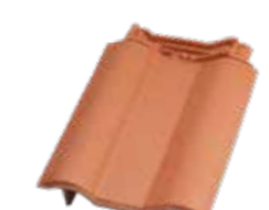
Ortgangziegel links Tandem®