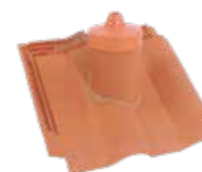
Antennenziegel – Dachneigung angeben