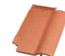
Ortgangziegel rechts Ravensberger