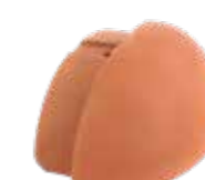
Walmanfang Standardfirst, groß