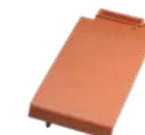
Ortgangziegel links Piano