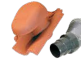
Sanitär-/Dunstrohr, Ø 100 inkl. Flexschlauch