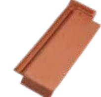
1/2 Ortgangziegel rechts Piano