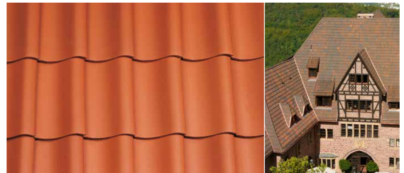
Sonderanfertigung Hohlziegel Wartburg