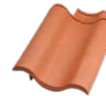
Ortgangziegel links Vario Hohlfalzziegel®