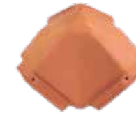
Walmkappe Piano First