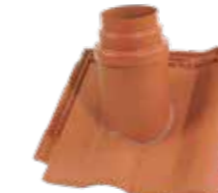
Thermendurchgang mit Manschette