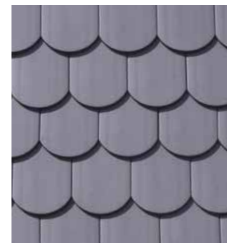
Rundschnitt | tiefgrau

Soll ein Dach sicher und individuell eingedeckt werden, ist der Biberschwanz genau richtig. Mit ihm lassen sich die unterschiedlichsten Arten der Dachgestaltung ausführen: z.B. Gauben, Kehlen, Türme, Kuppeln und Kamine. Bedarf je nach Biberformat ca. 34 – 71 Stück pro m 2