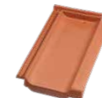
Ortgangziegel rechts Dacapo