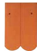
Rundschnitt geteilt (Doppelbiber)

Soll ein Dach sicher und individuell eingedeckt werden, ist der Biberschwanz genau richtig. Mit ihm lassen sich die unterschiedlichsten Arten der Dachgestaltung ausführen: z.B. Gauben, Kehlen, Türme, Kuppeln und Kamine. Bedarf je nach Biberformat ca. 34 – 71 Stück pro m 2