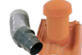
Dunstrohr inkl. Haube, Ø 150 inkl. Flexschlauch