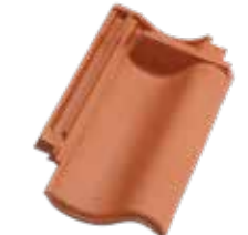
Firstanschlussziegel Vario Hohlfalzziegel®