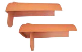
Firstanfänger plus außen Firstanfänger plus