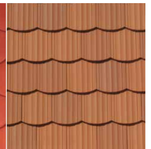
Segmentschnitt 5-rillig | naturbunt