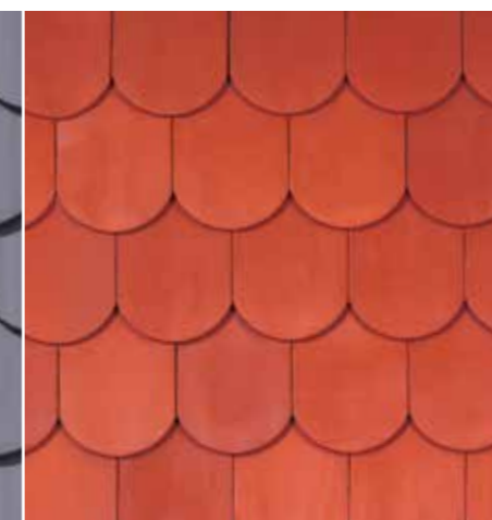
Rundschnitt | naturrot