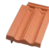
Ortgangziegel links Doppelfalz