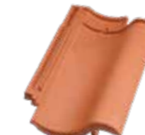
Ortgangziegel rechts Vario Hohlfalzziegel®