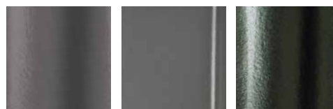
platynowo-szara karbonowo-szara łupek