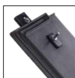
Meyer-Holsen komunikacja dachowa Modele Piano