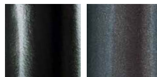
głęboka czerń grafitowa